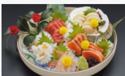
刺身 盛り合わせ イメージ